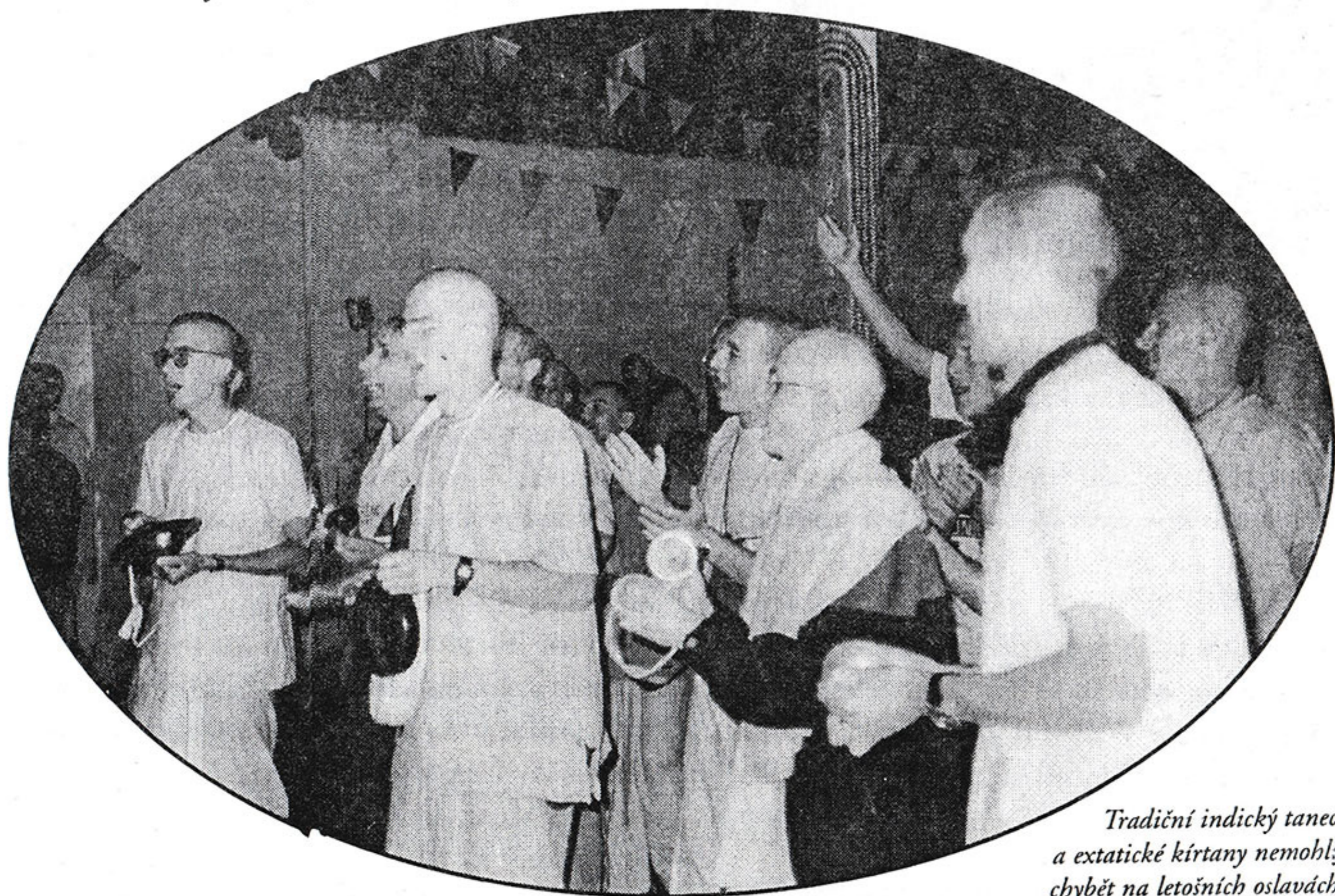
Tradiční indický tanec a extatické kirtany nemohly chybět na letošních oslavách zjevení Šrí Kršny.

návku nejpozději do 8. ledna roku 1999 (směrodatné bude datum na razítku podací pošty) a hodnota objednaného zboží bude minimálně 400,-Kč. Přesáhne-li hodnota zboží 1000,-Kč, nebudeme ke slevě (5%) připočítávat také poštovné a balné. Věříme, že si z nabídky vyberete.